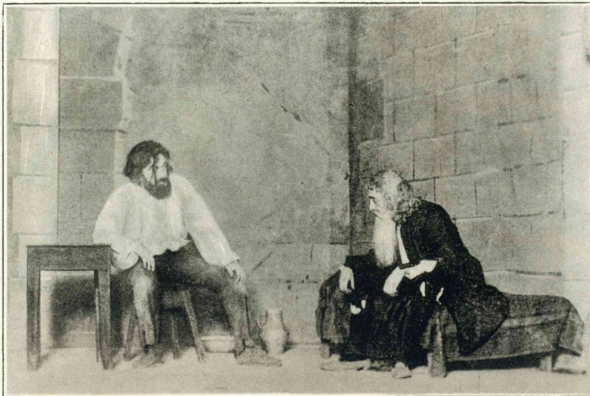
EDMOND DANTÈS, en abbé Faria in de cel van Château d'If, waar zij nooit geweest zijn (zie artikel).

Met de gevangenis van Château d'If staat dus de gemaskerde onbekende in geenerlei verband, evenmin als daar, volgens de romantische geschiedenis van Dumas, Dantès gezocht heeft. Wel hebben verschillende bekende persoonlijkheden uit de Fransche geschiedenis er de ellende van het gevangenisleven gekend, zooals de graaf de Mirabeau, de eigenaardige figuur uit den revolutie-tijd, en Philip van Orleans, bekend als Philippe Egalité, die zich onder de omwenteling bij de revolutionairen aansloot, doch niettemin later een der vele slachtoffers van de guillotine werd. Doch ook zonder den mysterieuzen achtergrond van Dantès of den man met het ijzeren masker, welke geschiedenis intusschen voor de exploitatie van Château d'If niet onvoordeelig is, is deze gevangenis voor toeristen interessant genoeg om een denkbeeld te verkrijgen van vroegere kerkers en de redenen, waarom men er menschen opsloot.