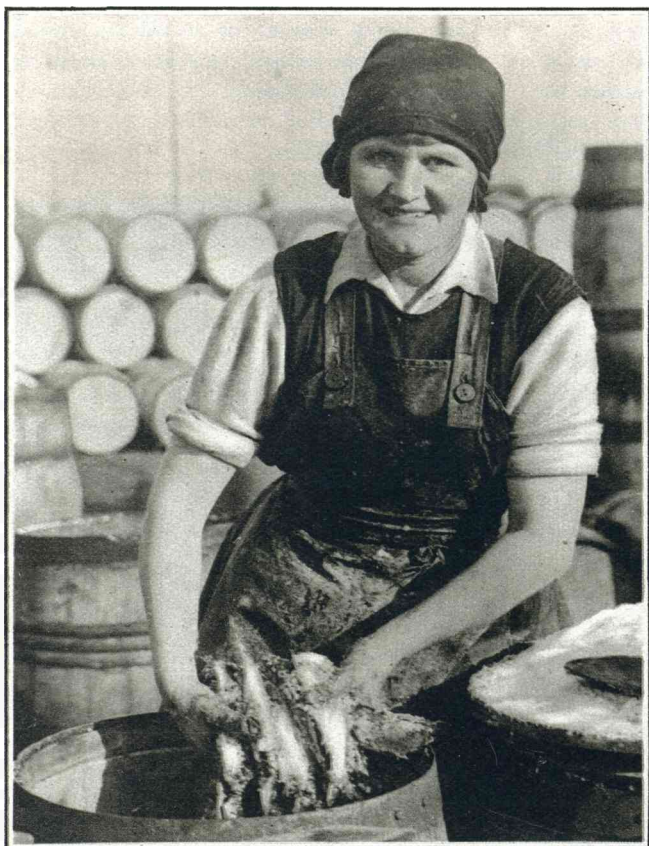
HET HARINGSEIZOEN te Yarmouth is weer aangevangen.