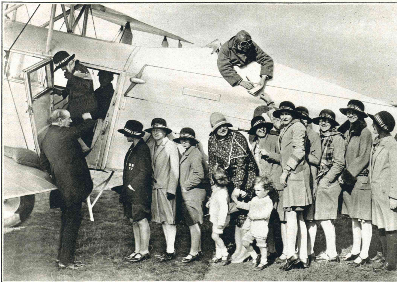
SIR ALAN COBHAM, de beroemde Australische vlieger, maakt momenteel in rondvlucht boven Engeland. Eenige schoolkinderen mogen gratis een toertje doen in zijn vliegtuig.