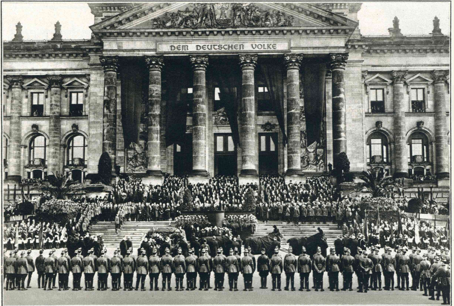
DE BEGRAFENIS VAN DEN OVERLEDEN RIJKS- MINISTER DR. GUSTAV STRESEMAN te Berlijn. De stoet vertrekt van het Rijksdaggebouw.