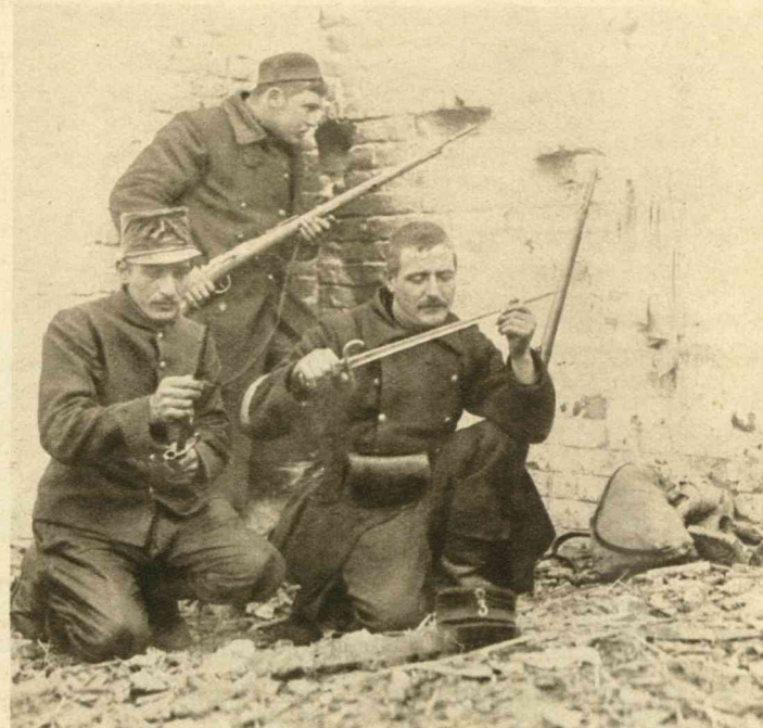
De wapens worden zorgvuldig nagezien. In de muren zijn ter betere verdediging schietgaten gemaakt.