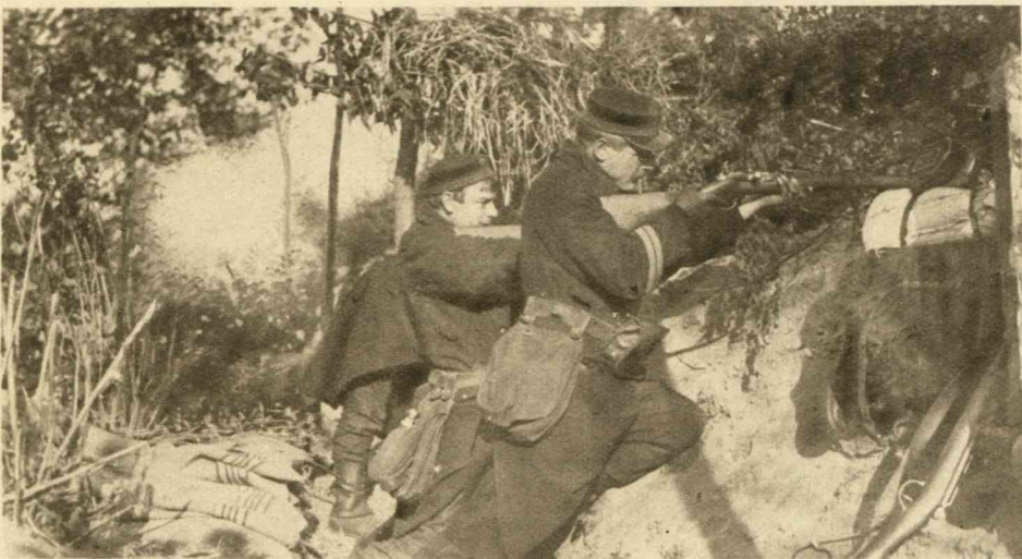
Achter het kreupel hout verborgen wachten zij de komst van den vijand af.