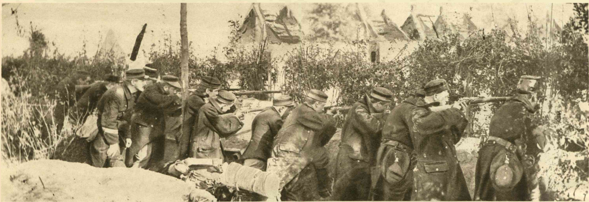
DE BELGISCHE SOLDATEN HEBBEN ZICH ACHTER EEN HEG IN EEN LOOPGRAAF VERDEKT OPGESTELD.