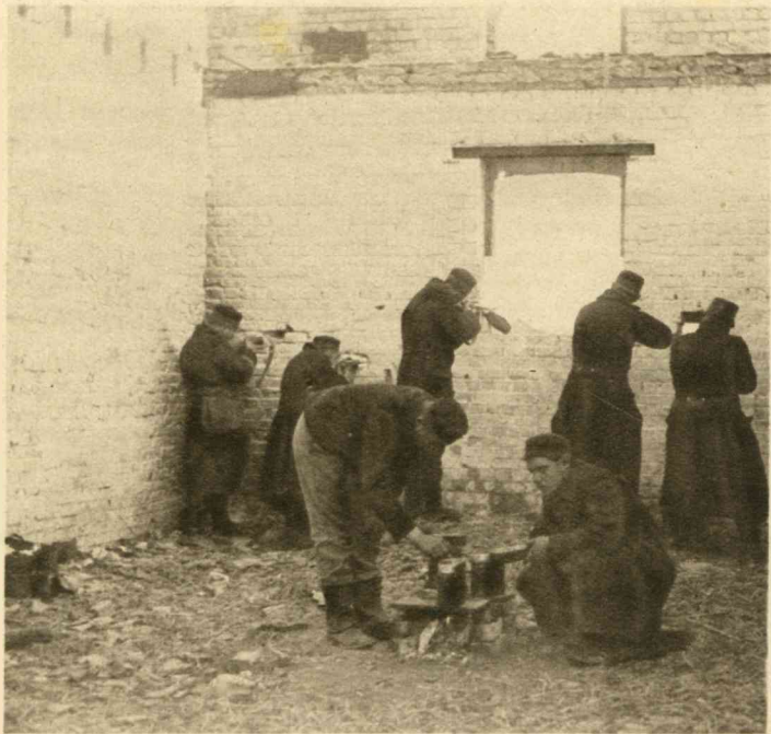
De soldaten hebben dekking gezocht in een door de artillerie verwoest huis.