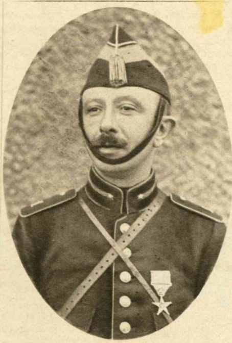
Een Belgisch officier, die bij Luik heeft medegestreden en begiftigd is met de zoogenaamde Luik-medaille.