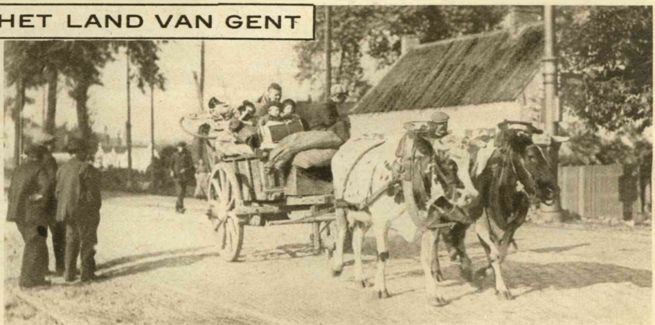
De melkkoeien voor de wagen gespannen en daarmee weggevlucht.